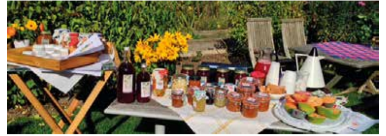
Skogsökolonisterna dukar upp frestelser från lokala odlingar.

Saltsjöbadens hembygdsförening är i full gång med förberedelserna för årets Höstmarknad på Neglinge gård den 6 oktober