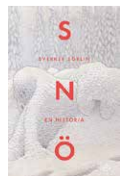
"Snö - en historia" (Volante förlag) av Sverker Sörlin.