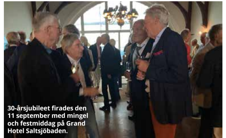
30-årsjubileet firades den 11 september med mingel och festmiddag på Grand Hotel Saltsjöbaden.