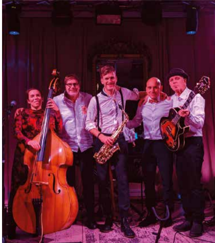
Orkestern Willes Vänner inleder festligheterna på Vår gård med låtar från 1924.