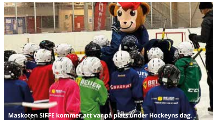
Maskoten SIFFE kommer att vara på plats under Hockeys dag.