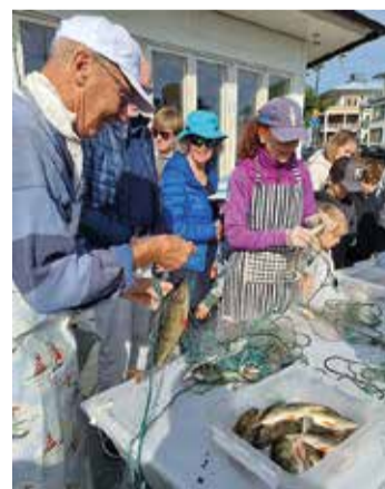
Provfiske i Baggen av Saltsjöbadens fiskevårdsförening.

- Vi tycker det är roligt när många stannar upp och frågar, framhåller föreningen som gärna vill få fler medlemmar.