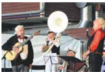
Allsång på varvet 2015 med Saltis Kultur & Nöjen.