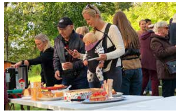
Kaffe, saft och mycket hembakt hör till när Saltsjöbadens Hembygdsförening bjuder på höstmarknad på Neglinge gård.