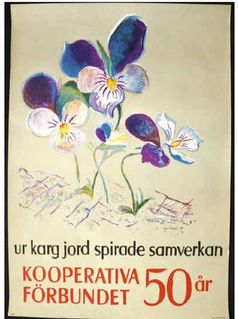
Kooperativa Förbundet slog på stort till sitt 50 års jubileum och gav Saltsjöbadskonstnären Sven X-et i uppdrag att göra jubileumsaffischen. Affischen trycktes i 70 x 100 cm hos Svenska Tryckeri AB, Stockholm