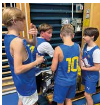
Fullt fart i Tippenhallen när Saltsjöbadens IF Basket hade öppet hus för att kicka igång säsongen.