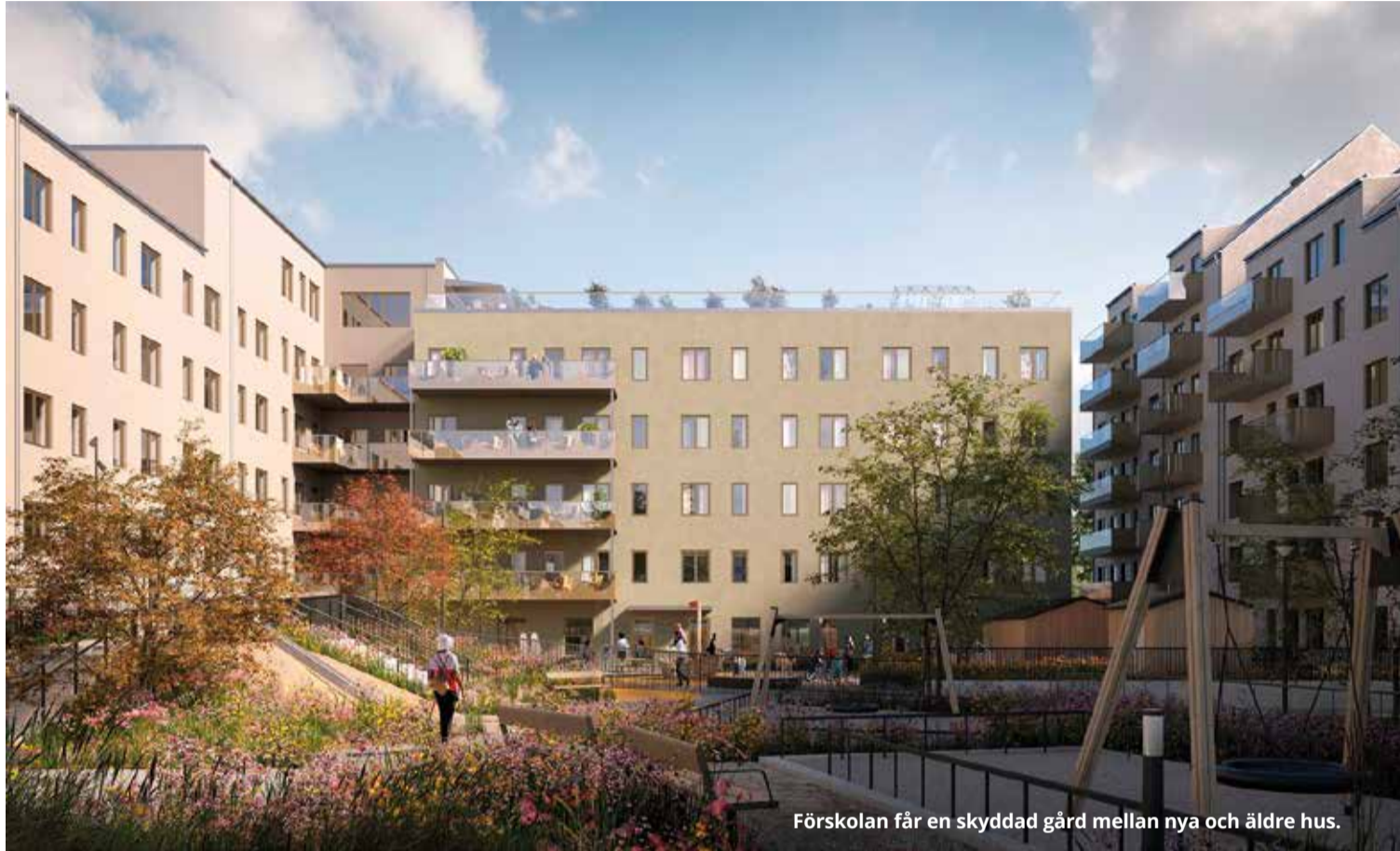
Förskolan får en skyddad gård mellan nya och äldre hus.

Da Vinciskolan har tecknat avtal med Stena Fastigheter för att hyra nya lokaler för Gröna Dalens förskola i Fisksätra entré, där förskolan ska starta verksamhet i samma hus som ett nytt äldreboende.