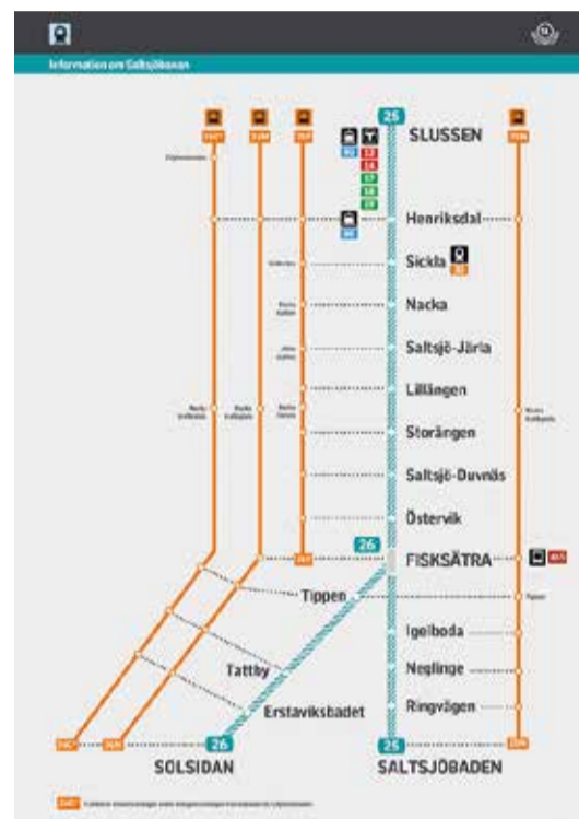
Så här går Saltsjöbanans ersättningsbussar linje för linje.