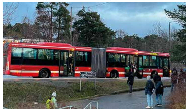
Bussar som står vid vägkanten är en vanlig syn alla dagar numera.